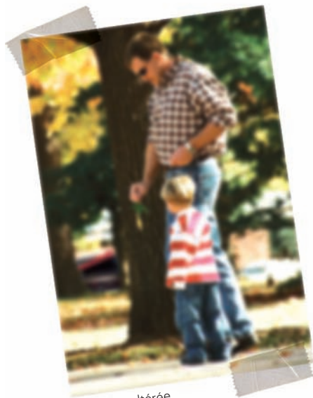
Vision altérée par un kératocône